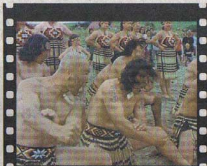
Un mito de más de mil años. Los maoríes dicen descender de Paikea, el Jinete de Ballenas.