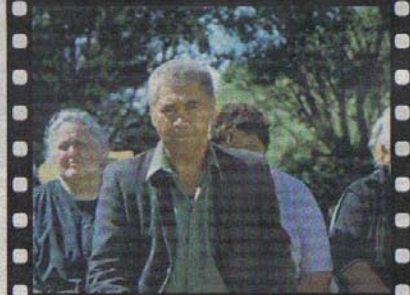
Heredera de la tradición. El abuelo cree que Pai, por ser mujer, no se merece el título.