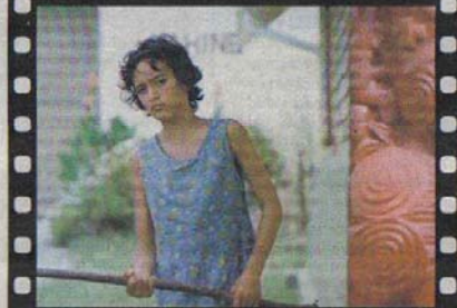
Camino del liderazgo. Pai, a pesar de las dificultades, se esforzará para cambiar su destino.